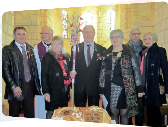
Les présidents après la messe dans l'église St-Pierre