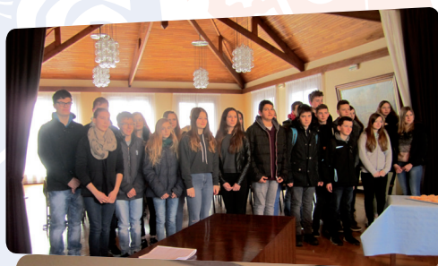
Partage du verre de l'amitié à la mairie

Le vendredi, en fin de matinée, les collégiens et professeurs allemands et français étaient reçus à la mairie pour partager le verre de l'amitié avec les adjoints et les conseillers.