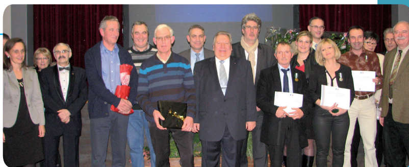
Les employés médaillés

La soirée s'est prolongée autour d'un buffet, servi par les conseillers.