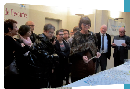
Remise des prix