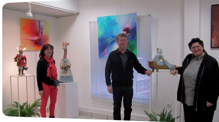
Les trois invités d'honneur devant leurs œuvres