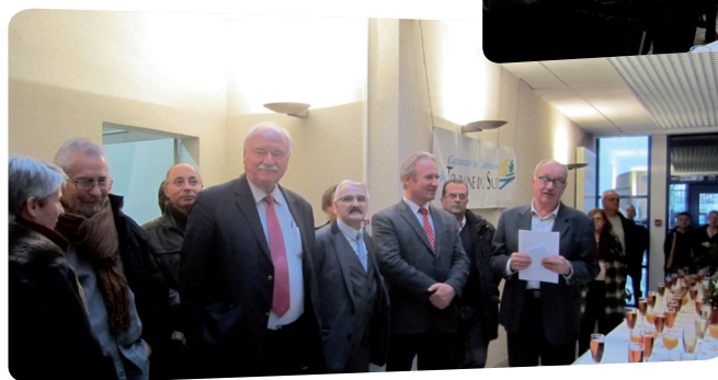
Lors du vernissage